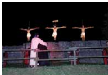
La scena della Crocifissione

Il racconto delle vicende della tradizione è iniziato quindi con la proiezione del film della durata di circa 45 minuti dall'altare della chiesa e poi è continuato all'esterno quando i fedeli da semplici osservatori sono diventati parte integrante della narra-