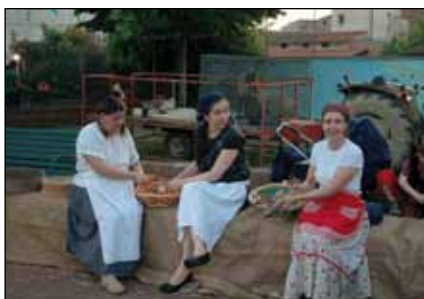
Alcune scene della festa "Con i Rioni Rivivi il passato"