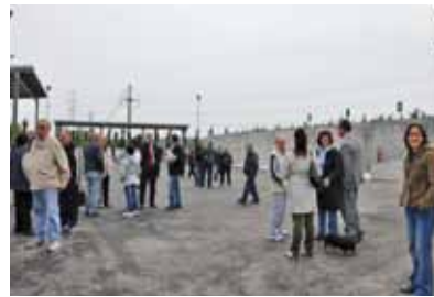
Un momento dell'inaugurazione

E' stato inaugurato sabato 30 aprile il nuovo Centro di Raccolta informatizzato in via del Marrucco che servirà i Comuni di Calcinaia e Vicopisano. La stazione ecologica è situata di fronte al Green Park, e ultimata nel tempo record di un anno, in anticipo rispetto alla soglia prevista di giugno. Colpiscono, oltre all'attenzione per il verde che la circonda e alla videosorveglianza costante, anche le grandi dimensioni (ben 2.500 mq). Un passo molto importante per le politiche ambientali del nostro Comune, fortemente voluto dall'Amministrazione e celebrato con grande soddisfazione dal Sindaco di Calcinaia, Lucia Ciampi che, assieme al Sindaco di Vicopisano Juri Taglioli e al Presidente di Geofor Paolo Marconcini, ha tagliato il nastro che di fatto ha sancito l'avvio della nuova stazione ecologica.