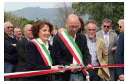
Un momento dell'inaugurazione

Va ricordato infatti che gli obiettivi di legge fissano al 65% la percentuale di raccolta differenziata da raggiungere per il 2012. Per ottenere questo risultato è necessario rafforzare l'impegno di tutti gli attori chiamati in causa: Cittadinanza, Comuni e Geofor. Si ricorda infine che rimane attivo il servizio di ritiro ingombranti domiciliare. E' sufficiente in questo caso contattare il numero verde 800 959095.