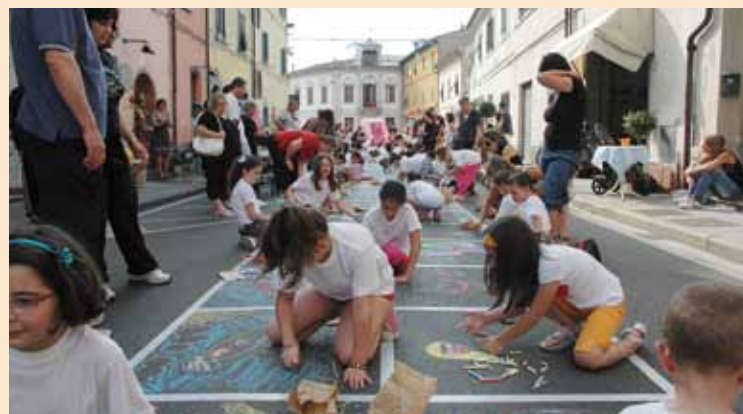
Un'immagine della scorsa edizione della festa