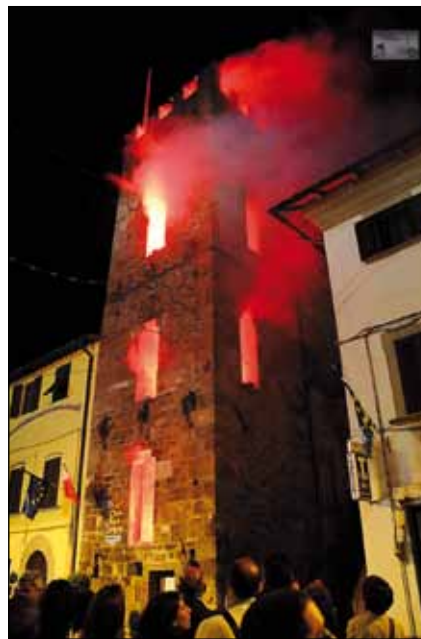
Fuochi nella Torre degli Upezzinghi

Il lunedì 23 sarà invece la volta del tradizionale spettacolo dei giovani, "Gente di festa", sicuro divertimento in attesa del fine settimana ricco di eventi. Sabato 28 maggio ogni angolo dei rioni sarà protagonista del sempre seguitissimo "Con i rioni rivivi il passato", per la consueta e spettacolare festa di rievocazioni storiche e circensi dal '400 al '900 che li vedono protagonisti. Evento attesissimo della domenica sarà la regata dei tre equipaggi di Montecchio, Nave e Oltrarno, la sfida che da 176 anni vede il fiume trasformarsi in un