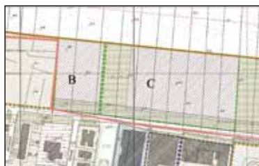
Regolamento Urbanistico attuale

E' prevista inoltre la realizzazione di un parcheggio pubblico in testata di via Morandi e di spazi a verde pubblico e di corredo delle attrezzature.