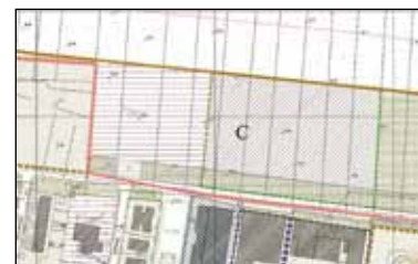
Regolamento Urbanistico dopo la Variante

La Variante introduce specifiche indicazioni normative per la realizzazione della nuova attrezzatura scolastica, ed in particolare: