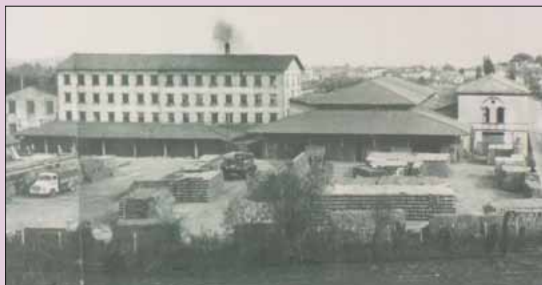
La vecchia fornace Leoncini

un punto di riferimento per le attività gestite o patrocinate dal Comune. "A Fornacette mancava uno spazio simile, e se ne sentiva l'esigenza - continua l'assessore Gonnelli - sarà un luogo dove si potranno riunire anche le associazioni, non appena avremo stilato un regolamento d'uso che ne definisca la gestione". La sala, allestita con il prezioso contributo della Banca di Credito Cooperativo di Fornacette e dell'Ufficio Tecnico comunale, sarà attrezzata con un video proiettore, un impianto di amplificazione, un tavolo per riunioni e poltroncine mobili, grazie alle quali sarà possibile anche avere il pavimento libero in occasione di rappresentazioni. Sotto lo storico tetto a travi di legno sarà installata anche una pedana che potrà ospitare non solo spettacoli teatrali di professionisti, ma anche le recite dei ragazzi delle scuole, che finalmente avranno un luogo adeguato nel quale esibirsi. Alle pareti