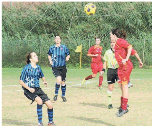
Una partita di calcio femminile