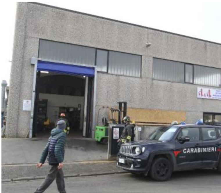
Il cantiere dove è accaduto l'incidente

«Spesso anche sul personale: un lavoro che dovrebbe essere svolto da 4-5 persone viene fatto da 2»