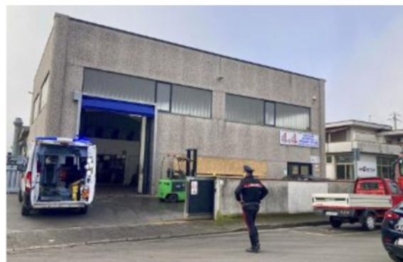
I soccorsi dei due operai caduti dal tetto

«E' arrivato il momento di istituire il reato di omicidio, lesioni gravi e gravissime sui luoghi di lavoro»