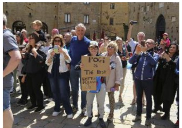
A sinistra la folla in piazza Timisoara a Fornacette e a destra la tappa finale del passaggio del Giro nella nostra provincia, in piazza dei Priori a Volterra