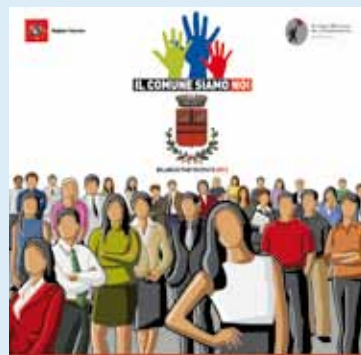
"Il Comune siamo noi"

L'obiettivo principale di questo percorso di partecipazione è quello di creare nuovi spazi di discussione e nuovi strumenti operativi che consentano ai cittadini di incidere nella definizione delle politiche del Comune. Attraverso un ampio coinvolgimento della popolazione verrà realizzato il bilancio partecipato del Comune, un processo di democrazia diretta attraverso il quale comuni cittadini possono discutere e prendere decisioni su materie generalmente delegate alla Giunta (Sindaco e Assessori) e al Consiglio comunale, quali il