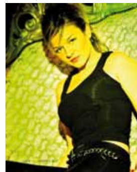
La presentatrice Serena Boldrini

Novità sensazionale per il Comune di Calcinaia che il prossimo 21 Settembre sarà teatro dello SmallMovie Festival 2012 , il primo festival di cortometraggi organizzato nel nostro paese dall'Associazione