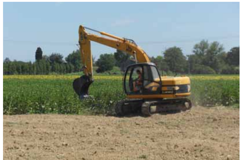
Alcune foto che mostrano l'inizio dei lavori in Via della Lucchesina