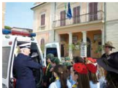
Il gruppo scout di Calcinaia

Tanti bambini sognano da piccoli di diventare un giorno un Vigile del Fuoco, un Carabiniere o un altro membro delle forze di polizia, sono mestieri che affascinano e rendono affascinanti e quest'anno, nel nostro gruppo, qualcuno di questi bambini ha potuto sognare ad occhi aperti! Le Coccinelle del cerchio "Sul Sentiero della Gioia" e i Lupetti del branco "Il Favore della Giungla" del gruppo scout CALCINAIA 1° "San Giovanni Battista" si sono lanciati insieme in una nuova avventura, hanno dimostrato di essere davvero in gamba e sempre pronti in ogni occasione. In questo intento sono stati aiutati da alcune persone che ogni giorno si mettono al servizio del prossimo, con assoluta dedizione, come: i Carabinieri del Comando di Pontedera, i Vigili del Fuoco del comando di Cascina e la Polizia Municipale del nostro comune. Il primo emozionante appuntamento è stato il 10 aprile 2010, quando Lupetti e Coccinelle hanno incontrato chi si occupa della nostra sicurezza sul territorio comunale: la