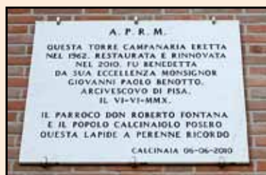
La targa affissa sulla torre campanaria