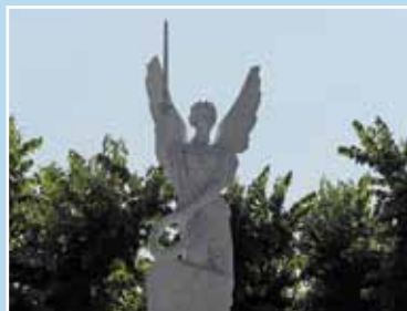
Il monumento ai Caduti in Piazza Indipendenza, prima e dopo l'intervento di ripulitura