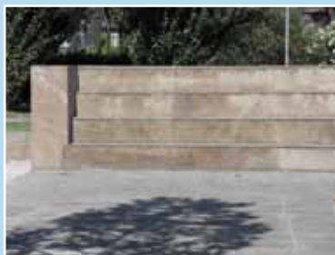
L'anfiteatro in Piazza Villanova del Cami, prima e dopo l'intervento di ripulitura