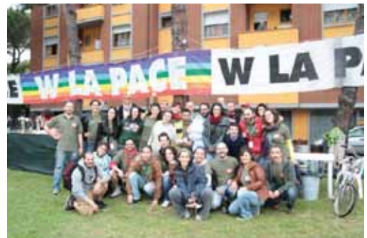
Il Gruppo del Comitato 25 Aprile

protagonista di questa Festa della Liberazione, è davvero lunga e ricca di eventi. Negli anni '70, Eugenio Bennato ha infatti dato vita alla Nuova Compagnia di Canto Popolare allo scopo di promuovere la musica etnica del sud Italia. Impegno coltivato nel corso del tempo fino alla fondazione del movimento "Taranta Power". Negli ultimi anni Eugenio Bennato si è esibito in un tour che lo ha visto suonare in tutto il mondo e nel 2011 su richiesta della nuova amministrazione comunale di Napoli ha fondato il Napoli Taranta Festival, dove nella prima edizione è stato musicato il concerto "Suite per orchestra e voci popolari" scritto proprio da Eugenio Bennato. Nel dicembre scorso è uscito il suo nuovo album "Questione Meridionale", che sarà eseguito gratuitamente per la piazza di Fornacette. Il 25 Aprile 2012 non sarà però solo un giorno di musica. Sarà una festa all'insegna dell'aggregazione per una comunità, quella del Comune di Calcinaia, che si aprirà a gente di qualsiasi età e luogo che dalla mattina alla sera avranno la possibilità di socializzare