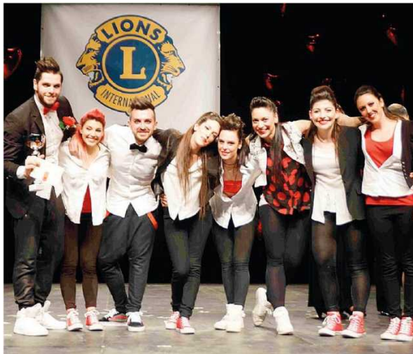
I vincitori della terza edizione, i "Fireworks" dell'Italy Dance Village di Pontedera