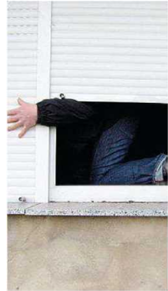
Un ladro in azione (foto d'archivio)

Stando a quanto si è appreso, dopo avere manomesso una telecamera della videosorveglianza i ladri sono entrati nel bar e hanno portato via il registratore di cassa che poi è stato ritrovato in un giardino dopo che era stato aperto per prelevare pochi spiccioli.