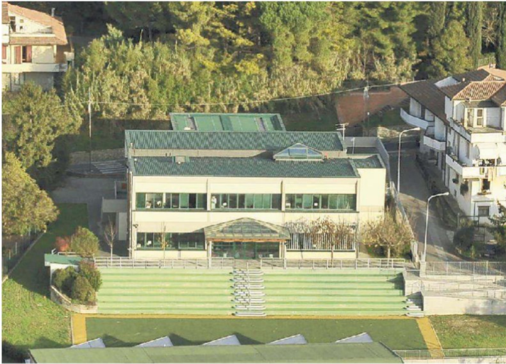
L'edificio che ospita le scuole medie a Peccioli potrà diventare sede delle associazioni