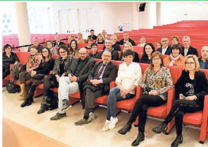
Alcuni dei soci che hanno ricevuto un attestato