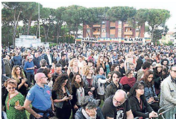
Il pubblico al concerto di Fornacette

Prima della performance principale, a partire dalle 17, mercatino eco-equo-solidale e opening act a cura della street band Moruga Drum e dei Matti delle Giuncaie.