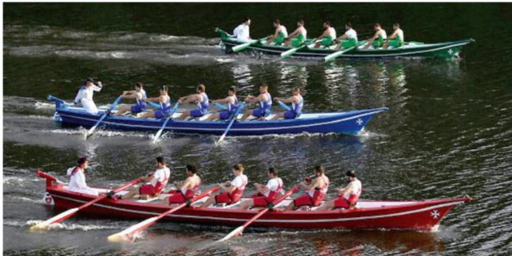
BATTAGLIA La regata storica di Calcinaia si annuncia spettacolare

Domani sera, alle 21.30, celebrazione religiosa con l'esposizione e il bacio della Reliquia di Santa Ubaldesca