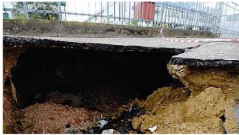
Nelle due foto la voragine che si è formata lungo la Tosco Romagnola a Fornacette di Calcinaia. È profonda quasi tre metri ed è larga un paio

L'asfalto ha ceduto all'improvviso. Probabilmente durante la notte. Ad accorgersi di quel che era accaduto - lungo la Tosco Romagnola, nella frazione di Fornacette di Calcinaia - sono stati i dipendenti e i titolari delle attività prospicienti. Una voragine larga oltre un metro e mezzo e profonda quasi tre: la buca si è formata all'altezza dell'azienda Ideal Bimbo e di una attività gestita da cinesi, nel tratto che va dalla carreggiata della Toscoromagnola, all'ingresso delle attività commerciali. Spazio che solitamente viene utilizzato da parcheggio. In direzione Firenze. Per fortuna quand'è avvenuto il crollo, su quello spazio non erano auto. Né transitavano persone. La zona è stata circonscritta. E' chiusa con delle transenne. Quella voragine si è aperta, stando alle prime indagini che sono state compiute dai tecnici del Comune di Calcinaia, su vecchie condotte di competenza del Consorzio Fiumi e Fossi. Saranno propri i tecnici dell'ente a occuparsi del sopralluogo. Anche perché c'è il rischio che altri cedimenti di asfalto possano verificarsi lungo le vecchie condutture sotterranee.