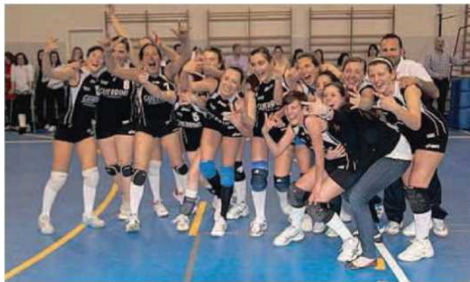
BRAVE Una grande vittoria per il volley di Fornacette e per la Polisportiva