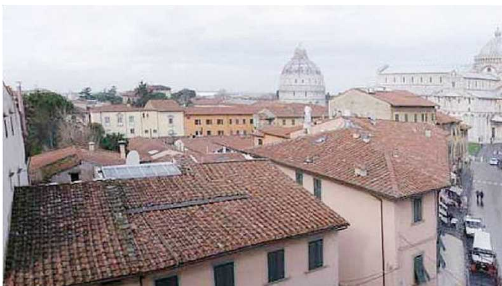
Una veduta di Pisa nella zona di Piazza dei Miracoli