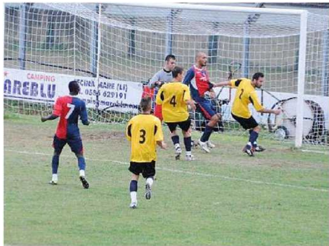
Una gara di Terza categoria Figc