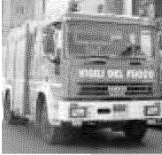
I vigili del fuoco di Cascina