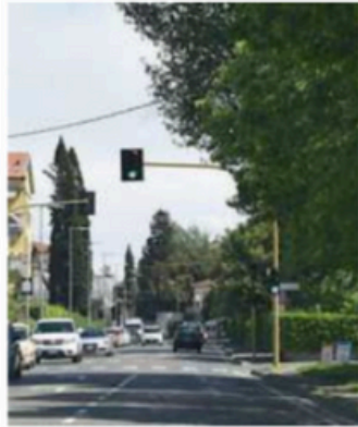
Il semaforo con T-Red installato in viale America a Pontedera